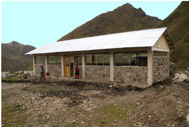
Einer der Speisesäle mit Küche

In den Hochanden von Peru konnten in den 14 Jahren die Summe von über 696.000 EUR eingesetzt werden: Die Einnahmen des 5. Benefiz-Golfturniers werden für die Gesundheitskampagnen der indigenen Landbevölkerung und für die Schulspeisungen der Kinder in den Hochanden von Peru verwendet.